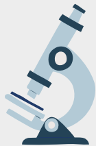
vector viral nereplicativ

Sistemul imun va identifica această proteină ca fiind străină, ceea ce va conduce la declanșarea răspunsului imun și, în consecință, producerea de anticorpi și celule T specifice. Dacă, mai târziu, persoana vaccinată intră în contact cu virusul SARS-CoV-2, sistemul său imun va recunoaște virusul și va fi pregătit să se apere.